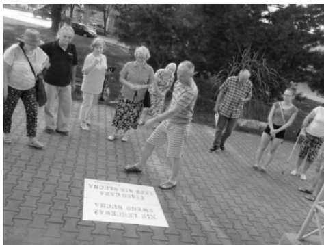
Warsztaty ceramiczne w Parku Rodzinnym w Chełmku.