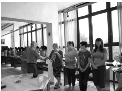
RSTK na imprezie stowarzyszeń w Oświęcimiu.