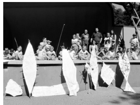
Zbiorowa wystawa RSTK w Galerii "Pod Muzam", Chrzanów, marzec 2016 r.