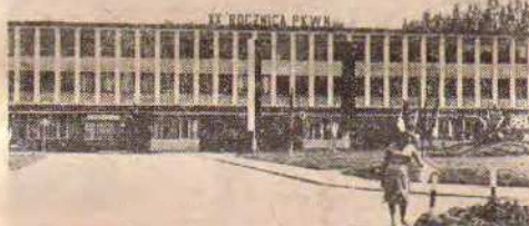
Okazały budynek administracyjny PZS i ukwiecone jego przedpole przedstawiają piękny widok.