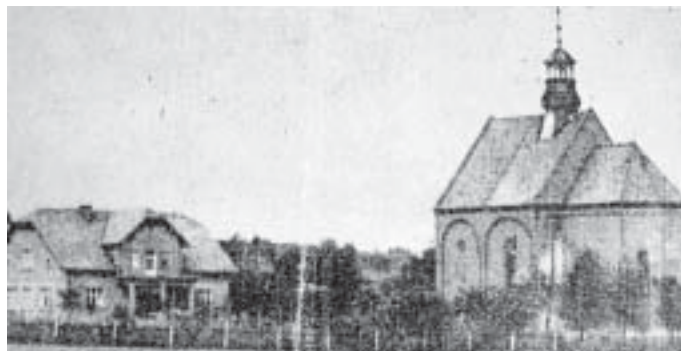
Kościół z plebanią