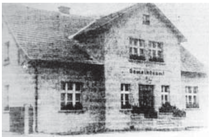
Budynek gminy zbiorczej.

Ograniczono program do nauki czytania, pisania i rachowania. Wymiar godzin dla klas I-IV – 12 godzin tygodniowo, a w klasach V-VII 16 godzin.