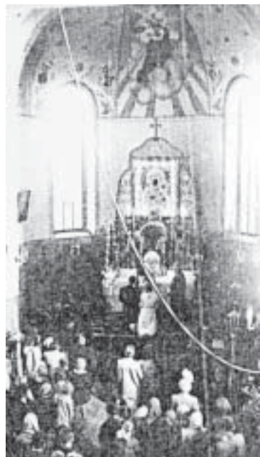
Pierwszy ołtarz, obraz i malowanie w prezbiterium.