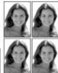
FOTO / Image / Marcin Łysak Chełmek ul. Krakowska 4 Zdjęcia do dokumentów

Sprzedam Cocker Spaniele Angielskie rude. Odrobaczona, z książeczką zdrowia. Odbiór koniec lipca. tel. 0661432553