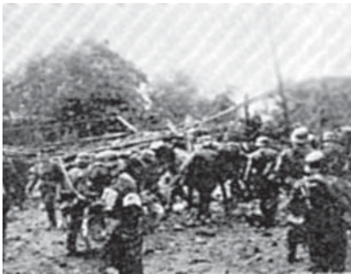
Zniszczony most na Przemszy

Wcześniej, po południu około godziny 16.00 został wysadzony most na Przemszy.