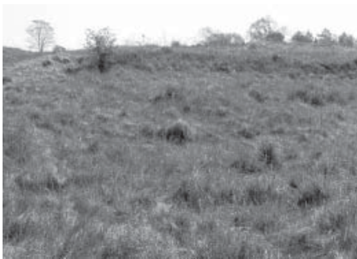
Miejsce walki na Skale

Rozpoczęła się przeprawa wojsk niemieckich przez Przemszę, część czołgów zajęło stanowiska na Smutnej Górce (niewielkie wzgórze nad Chełmem Małym). Polacy zaś przygotowali się do walki na Skale od strony zachodniej, poniżej cmentarza. O godzinie 17. zaczęła się wymiana ognia - od strony Niemców z armat, natomiast Polacy mieli do dyspozycji tylko jeden ciężki karabin maszynowy, karabiny i granaty. Po obu stronach rzeki zaczęły się palić domy i zabudowania gospodarze z tym, że w Chełmku zdecydowanie więcej.