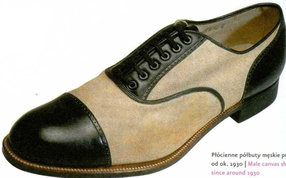
Płóciennie półbuty męskie produkowane od ok. 1930 | Male canvas shoes, produced since around 1930