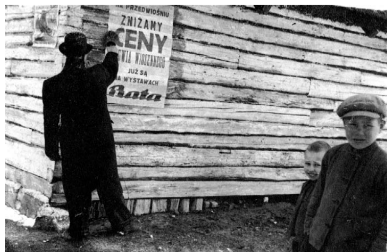
Fotografia przedstawiająca wywieszanie plakatu informującego o obniżce cen obuwia w fabryce Bata. Lata 30. XX wieku.