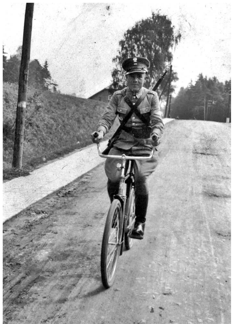
Policjant jadący ulicą Krakowską. Rok 1938.