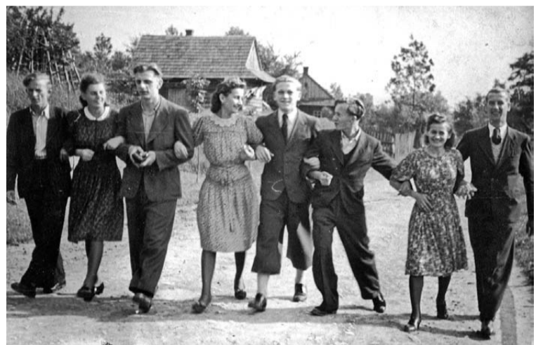
Fotografia wykonana w Chełmku, choć trudno odczytać gdzie dokładnie. Każdy, kto jest w stanie zidentyfikować osoby lub miejsce - proszony jest o kontakt z ośrodkiem kultury. Najpewniej zdjęcie ukazuje mieszkańców w latach 30. XX wieku.