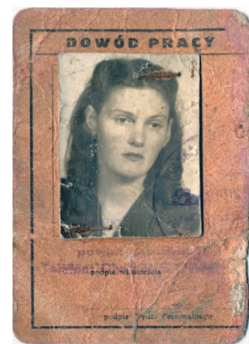
Dowód pracy, czyli przepustka wydawana w zakładach obuwniczych